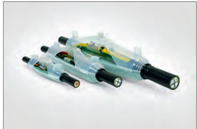
Verbindungsgarnituren i-Line SF (sicheres Füllen).