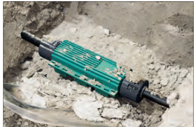
Reliseal Gel-Kabelgarnituren in drei Größen erhältlich.