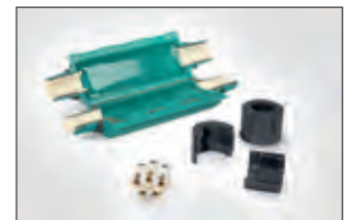
Gel-Kabelgarnitur Reliseal V 510.