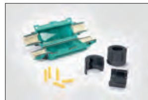
Gel-Kabelgarnitur Reliseal V 56.