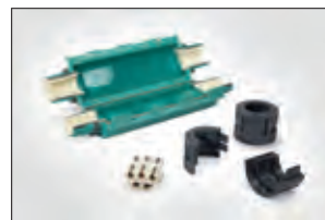
Gel-Kabelgarnitur Reliseal V 525.