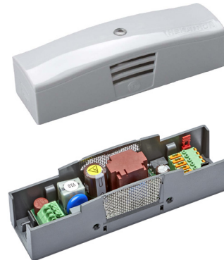
Feststellanlagenzentrale Kompakt mit Abdeckung

Die kleine und kompakte Bauform machen es möglich, dass die FSZ Kompakt fast unsichtbar an der Wand oder dem Sturz montiert werden kann. Zudem kann sie, aufgrund zusätzlicher Prüfungen, direkt auf der Türzarge montiert werden. Desweiteren ist es möglich die FSZ Kompakt in der Zwischendecke und somit komplett außerhalb des Sichtbereichs zu montieren. Dank der verschiedenen farblichen Ausführungen, kann die FSZ Kompakt ideal an die vorort