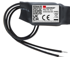
Mini-RC-Loeschglied Art.No: 10882

Spannung: 230 V AC ±10% Abmessungen: 38 x 12 x 26 mm Schutzart/-klasse: IP20 / Klasse II