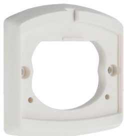
Aufputzrahmen LC Art.No: 91080

Spannung: 230 V AC ±10% Abmessungen: 50 x 23 x 8 mm Schutzart/-klasse: IP20 / Klasse II