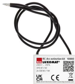
RC-Loeschglied Art.No: 10880

Abmessungen: Ø 164 x 143 mm Stoßfestigkeitsgrad: IK09 Gehäuse: beschichteter Stahlkorb