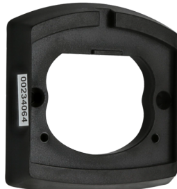
Aufputzrahmen LC Art.No: 91081

Abmessungen: 78 x 78 x 13 mm Gehäuse: Polycarbonat, UV-beständig Farbe: weiß