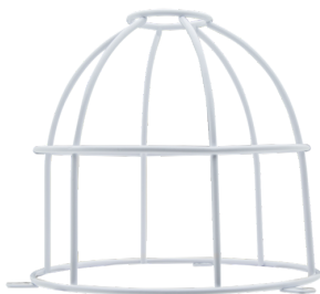
Ballschutzkorb BSK (Ø 164 x 143 mm) Art.No: 92467

Abmessungen: Ø 164 x 143 mm Stoßfestigkeitsgrad: IK09 Gehäuse: beschichteter Stahlkorb