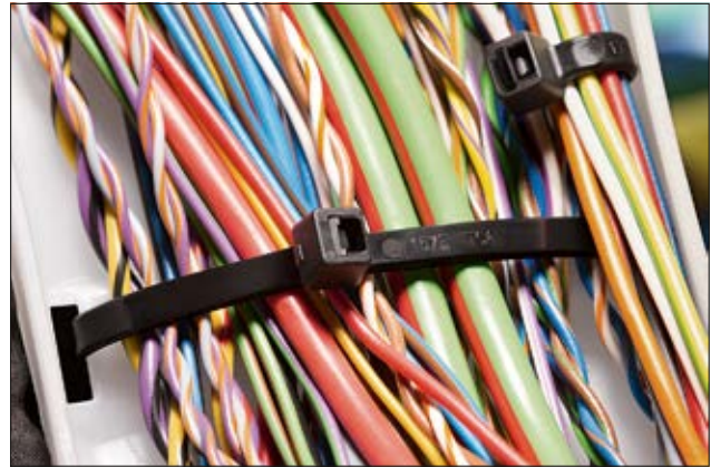
Kabelbinder der T-Serie sind universell einsetzbar (PA66).