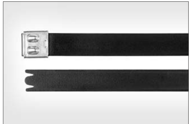
Edelstahlkabelbinder, beschichtet, MBT_UHDFC.