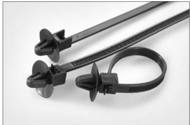
Lösbarer einteiliger Befestigungsbinder R50SD6 mit Spreizanker.