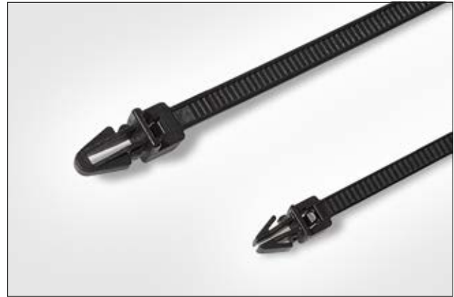
Bei engen Einbauverhältnissen eignen sich besonders die Kabelbinder T30RSF und T50RSF.