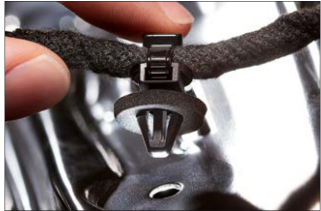
Die zusätzliche Dichtung des 2-teiligen Befestigungsbinders schützt verlässlich vor Spritzwasser.