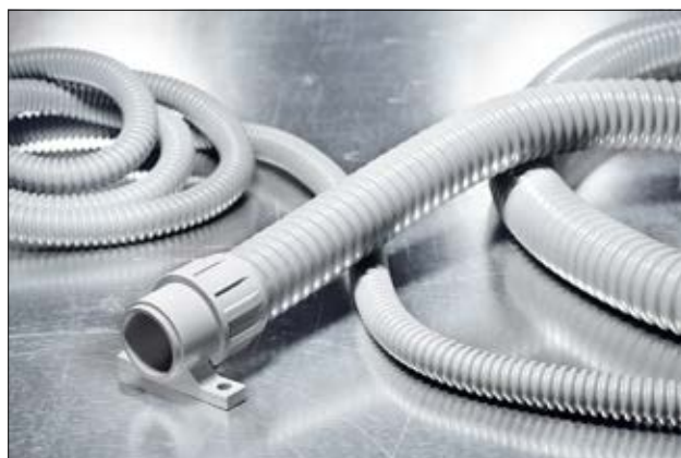
FlexiGuard FG mit Verschraubung FG-UH.