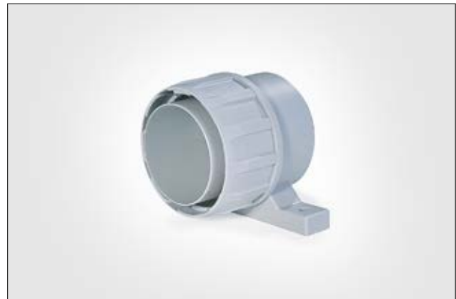
FG-UH Verschraubung mit Halter.