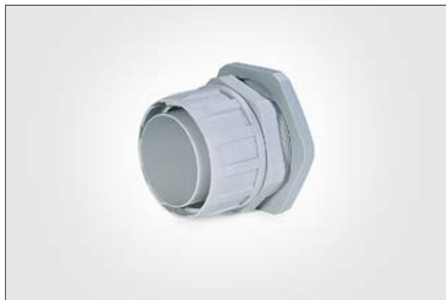
FG-M Verschraubung mit metrischem Gewinde.