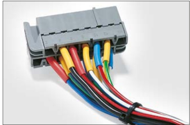
HFT-A in vielen Farben und Größen erhältlich.