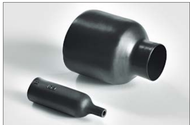
113-1-G ungeschrunft und vollständig geschrumpft.