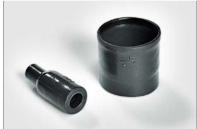
113-4-G ungeschrunft und vollständig geschrumpft.