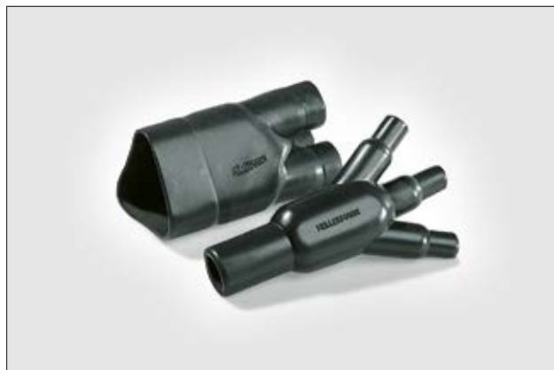
304-1-G ungeschumpft und vollständig geschumpft.