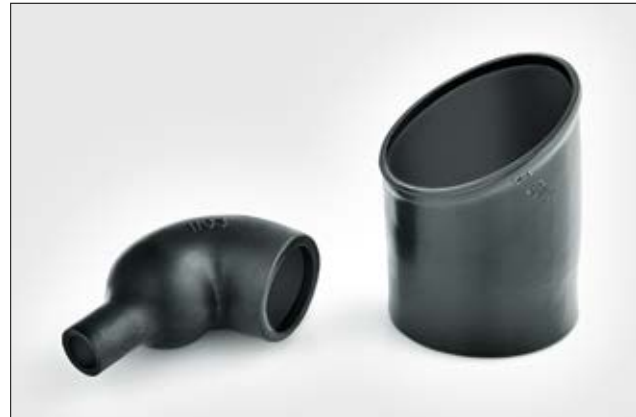
1108-4-G vollständig geschrumpft und ungeschrumpft.