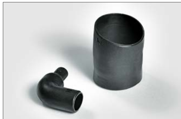
1108-1-G vollständig geschrumpft und ungeschrumpft.