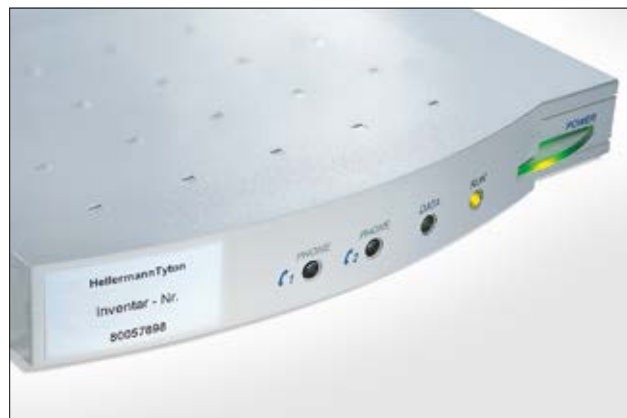
Dauerhafte Inventarkennzeichnung mit Helatag-Etiketten.