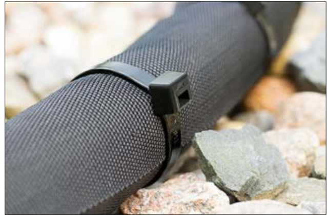
Schlagzähmodifizierter Kabelbinder der T-Serie (PA66HIRHS).