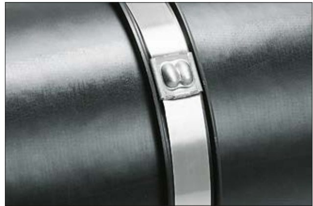
Edelstahlkabelbinder der MBT-Serie mit Schutzprofil LFPC150.