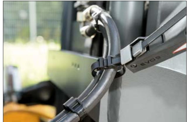
Außenverzahnte Kabelbinder mit glatter Innenseite zum Bündel (LPH-Serie).