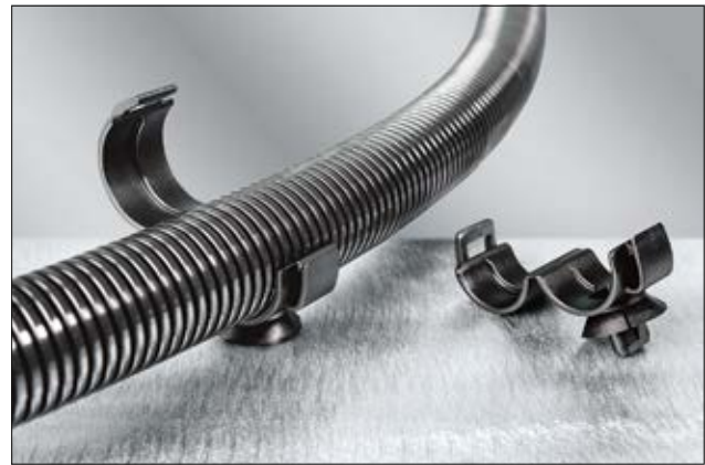
Einfache und sichere Montage von Wellrohren und Schläuchen auf Oberflächen mittels Spreizanker.