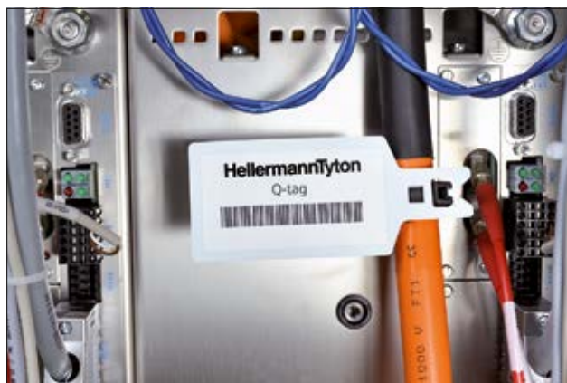
Q-tag – Eindeutige Kennzeichnung und gute Lesbarkeit bringen Sicherheit.