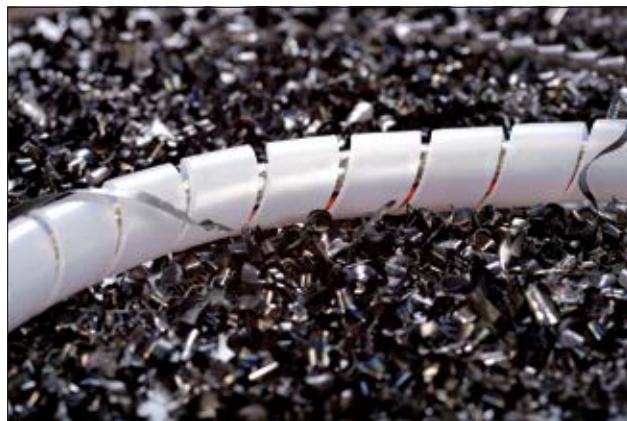
SPBA Spiralschläuche bieten optimale Abriebfestigkeit.