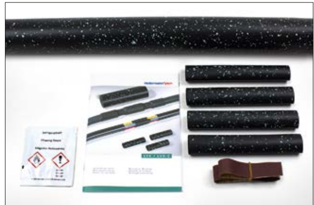
LVK - Inhalt der Warmschrumpf-Verbindungsgarnitur.