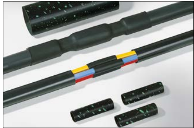
LVK - Warmschrumpf-Verbindungsgarnitur.