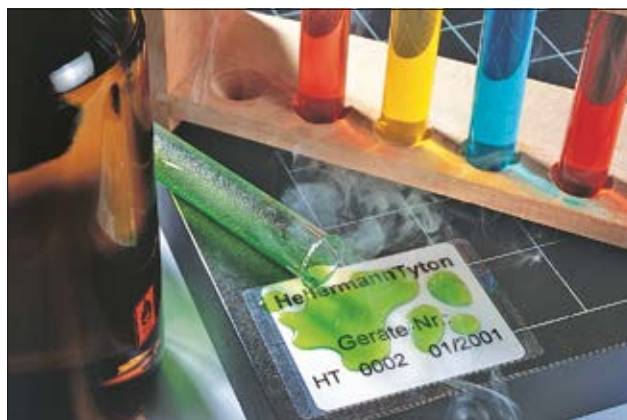
Wichtige Etiketten mit Helatag Schutzlaminat bestens geschützt.