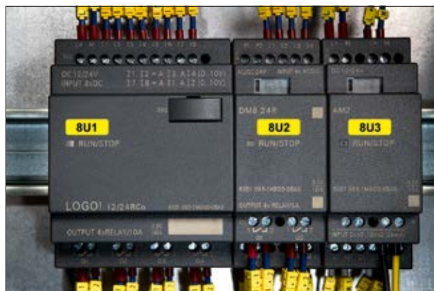
Helatag für die Kennzeichnung im Schaltschrank.