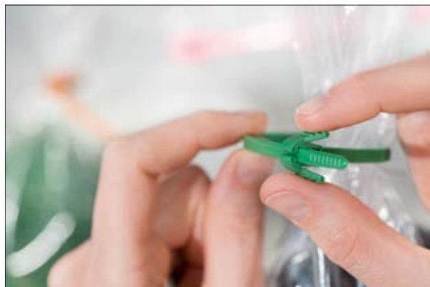
Die innenverzahnte REZ-Serie hat einen Flügelverschluss zum Öffnen mit nur einer Hand.