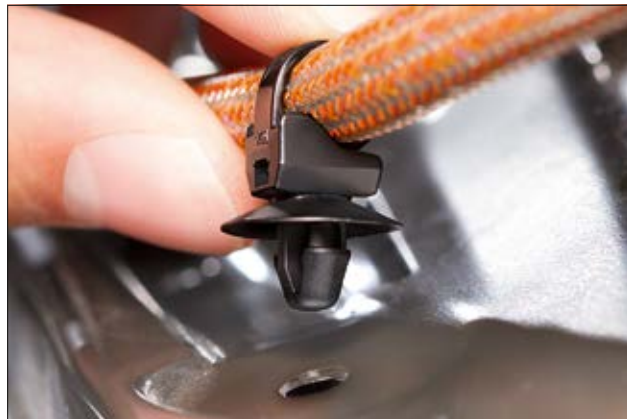
Der Teller am Kopf des T50SOSSFT6,5E schützt die Bohrung vor Schmutz.