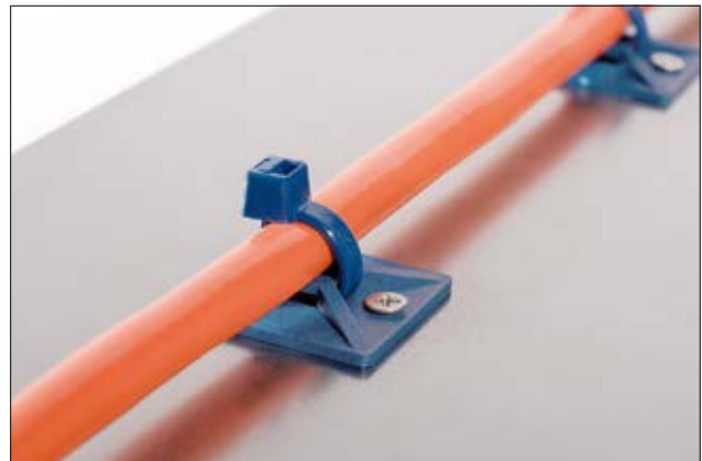
Detektierbare Befestigungslösung bestehend aus MCMB Sockel und MCT Kabelbinder.