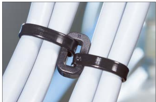
LOK04 Ring zur Parallelführung für mehrere Leitungen.