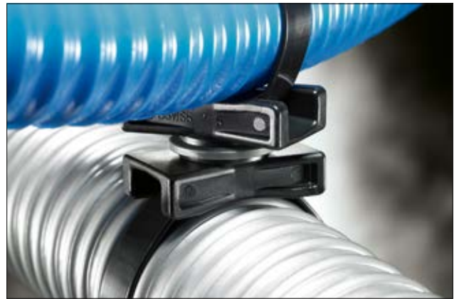
Die Elemente können einfach per Hand verdreht werden und so die Bündel längs oder quer geführt werden.