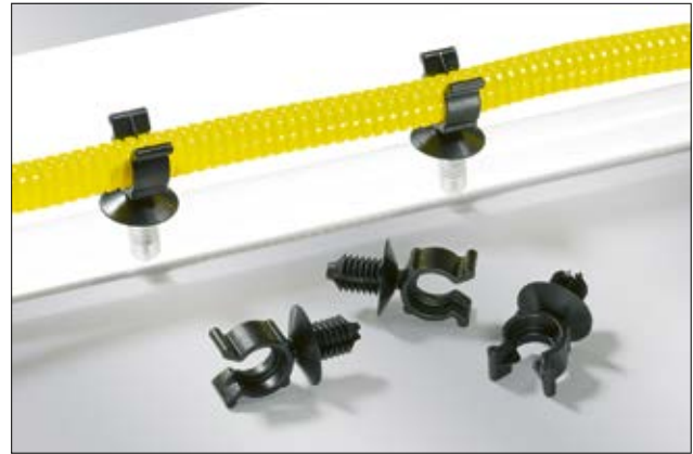
Durch Einklicken in die Aufnahme werden die Wellrohre sicher geführt.