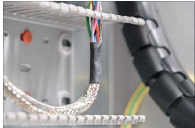
TF21 - erfüllt eine Vielzahl an Industrienormen.