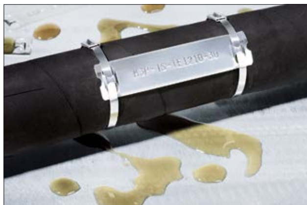
Kennzeichnung für extreme Umweltbedingungen: M-BOSS Compact Edelstahlmarkierer.