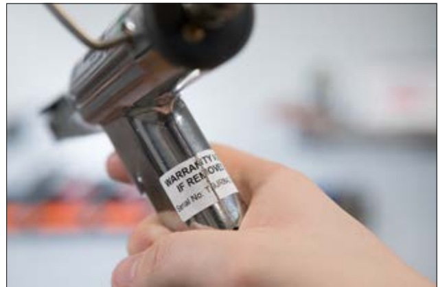
Helatag 1208 – manipulationssichere Garantiekennzeichnung.