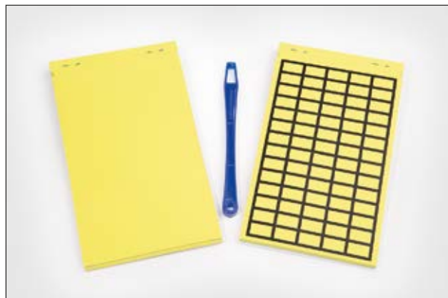
HELASIGN Gewebetiketten – robust und aufmerksamkeitsstark.