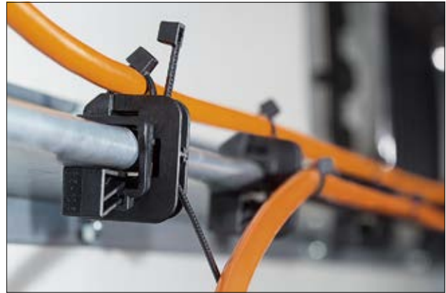
Die Trägerklammer wird auf die Kante eines Trägers geschoben und mit dem Keil fixiert. Mehrere Kabel, Leitungen oder Schläuche können parallel geführt werden.