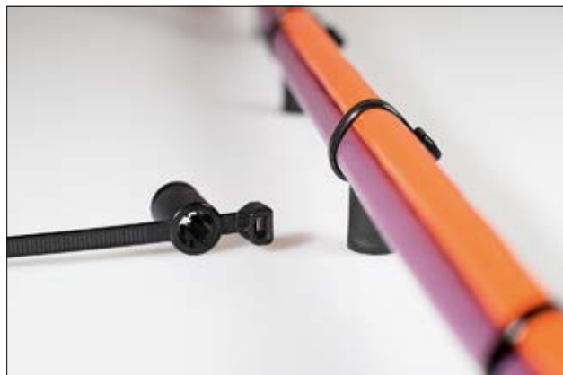
Die Befestigungsbinder T50SSBS50T-E und T50SSBS60T-E erlauben ein sehr genaues Führen eines Kabelstrangs.