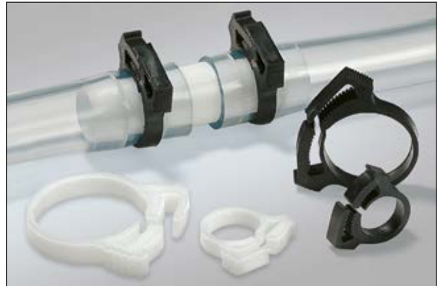
Snapper SNP-Serie für Rohre und Leitungen.