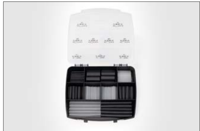
ShrinkKit 321-A Basic - 3:1 Schrumpfschlauch Sortiment mit 130 Abschnitten.