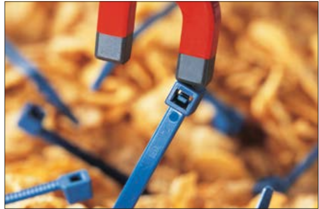
Unsere MCT(S) Kabelbinder zum Einsatz in der Lebensmittel- und Pharma-Industrie.