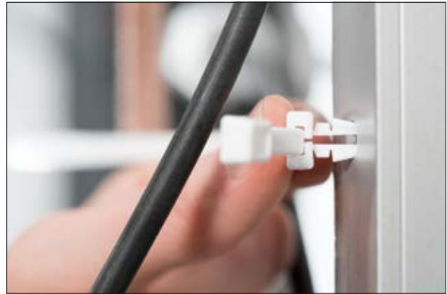
TM1SF ist für eine sichere Bündelung von Kabeln in vorgebohrten oder vorgestanzten Löchern geeignet.