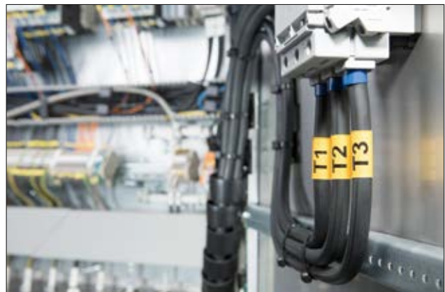
TULT DS – Schrumpfschlauchmarkierer mit einer guten mechanischen Festigkeit für vielfältige Anwendungen.