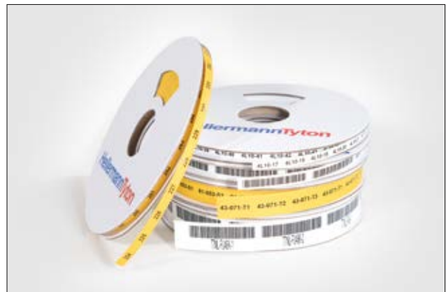
TLFX – erfüllt die Anforderungen der Bahnindustrie.