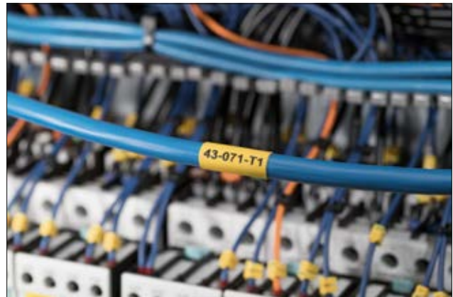
TLFX – halogenfreier Warmschrumpfschlauch für anspruchsvolle Anwendungen.