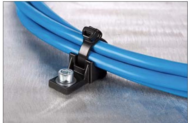
Das schlanke Kopfdesign der X-Serie eignet sich besonders für den Verbau unter beengten Platzverhältnissen.