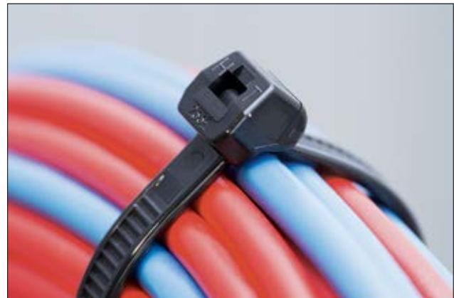
Außenverzahnte Kabelbinder der OS-Serie sind schonend zum Bündelgut (glatte Seite innenliegend).