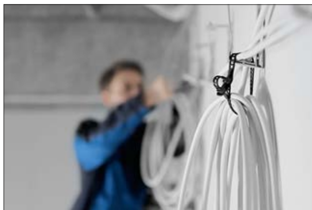
Durch die Elastizität der SOFTFIX Binder ist der Einsatz für viele Anwendungen möglich.