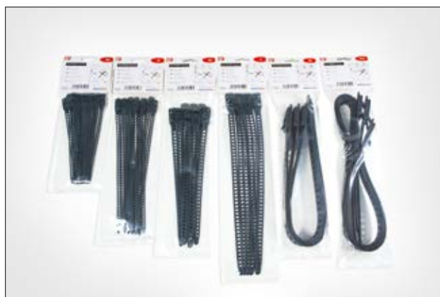
Die SOFTFIX Familie ist in praktischen Kleinverpackungen erhältlich.

i Mit zweiter Verriegelung für parallele Bündelung!