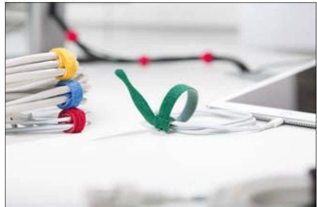
Durch das praktische Kabelbinderdesign kann der TEXTIE am Kabel verbleiben und geht nicht verloren.