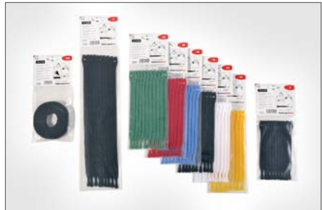
Die TEXTIE Serie ist in verschiedenen Farben und Längen erhältlich.