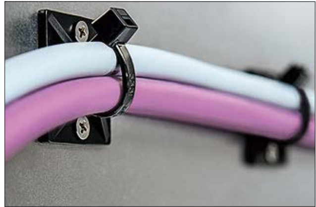
MB-Serie, quadratische Form, schraubbar/selbstklebend.