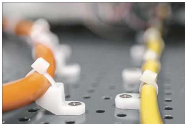
LKM, CL8 (l) und FH (r) Befestigungssockel für Anwendungen mit geringem Platzbedarf.