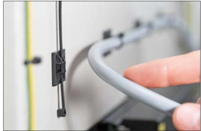
SolidTack-Serie mit Hochleistungskleber in Kombination mit einem Kabelbinder der T-Serie.